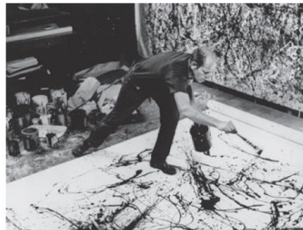
Jackson Pollock pinta con la técnica de dripping.